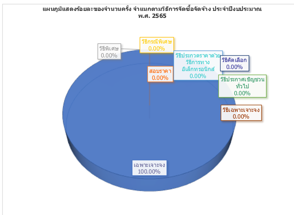
ตารางที่ 2 แสดงร้อยละงบประมาณ จำแนกตามวิธีการจัดซื้อจัดจ้าง ประจำปีงบประมาณ พ.ศ. 2565

ในปีงบประมาณ 2565(หน่วยงาน ศูนย์สุขภาพจิตที่ 7) ได้ดำเนินการจัดซื้อจัดจ้างมีจำนวนทั้งสิ้น 91 ครั้ง พบว่าวิธีการจัดซื้อจัดจ้างสูงสุดคือ วิธีเฉพาะเจาะจง จำนวน 91 ครั้ง คิดเป็นร้อยละ 100% รองลงมาคือ - จำนวน - ครั้ง คิดเป็นร้อยละ - และวิธี - จำนวน - ครั้ง คิดเป็นร้อยละ - วิธี - จำนวน - ครั้ง คิดเป็นร้อยละ - โดยวิธี - มีการดำเนินงานเพียง - ครั้ง คิดเป็นร้อยละ - ได้แก่ -