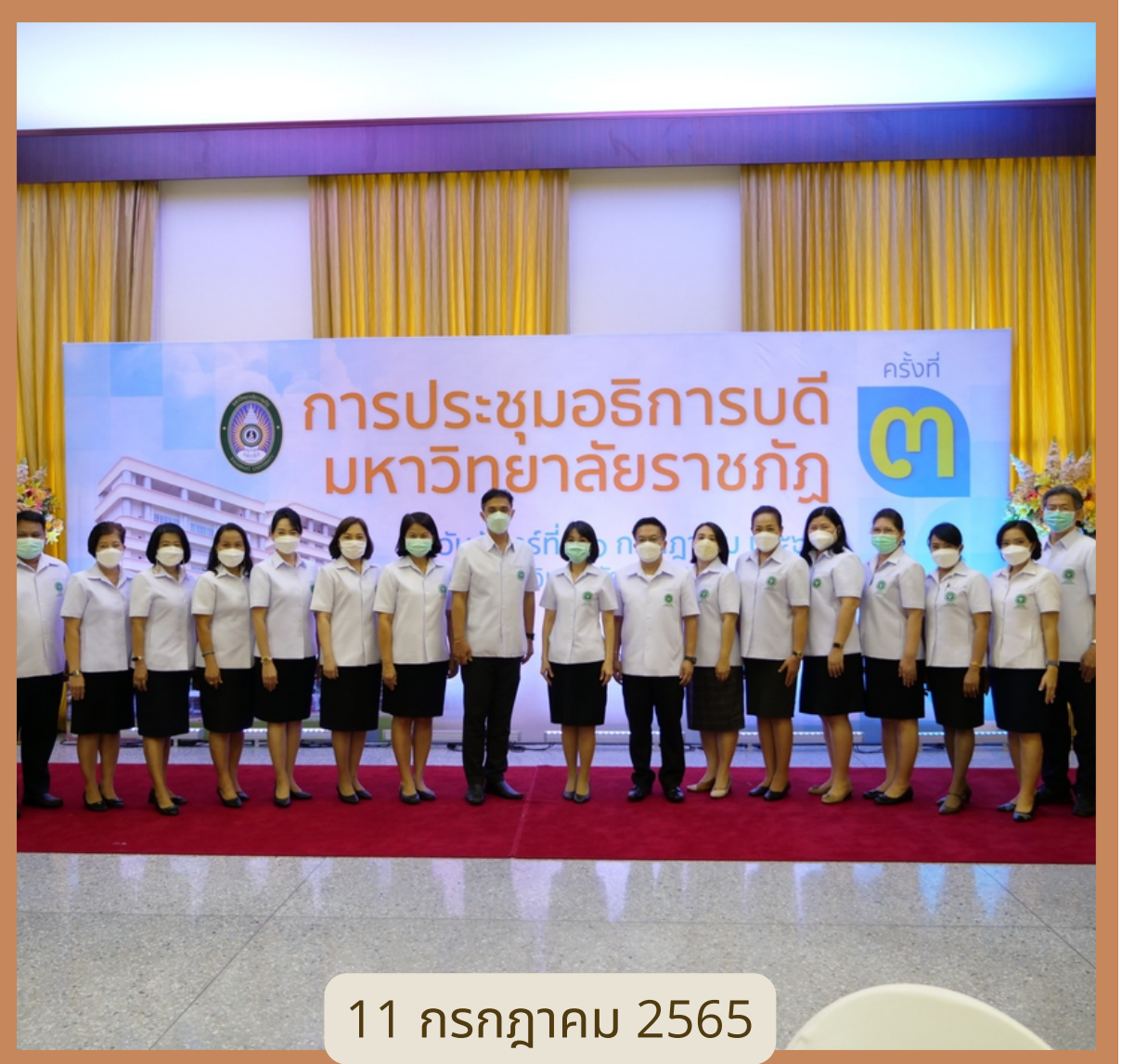
11 กรกฎาคม 2565