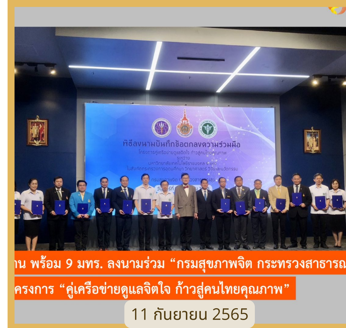
กรมสุขภาพจิต กระทรวงสาธารณสุข ร่วมลงนามบันทึกข้อตกลงความร่วมมือโครงการคู่มือดูแลสุขภาพจิตใจ ก้าวสู่คนไทยคุณภาพ พร้อม 9 มทร. ลงนามร่วม "กรมสุขภาพจิต กระทรวงสาธารณสุข กระทรวงการอุดมศึกษา วิทยาศาสตร์ วิจัยและนวัตกรรม" โครงการ "คู่มือดูแลสุขภาพจิตใจ ก้าวสู่คนไทยคุณภาพ"