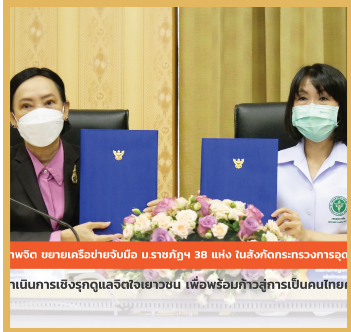
กรมสุขภาพจิต ขยายเครือข่ายจับมือ ม.ราชภัฏฯ 38 แห่ง ในสังกัดกระทรวงการอุดมศึกษา วิทยาศาสตร์ วิจัยและนวัตกรรม เพื่อบริการเชิงรุกดูแลจิตใจเยาวชน เพื่อพร้อมก้าวสู่การเป็นคนไทยคุณภาพ